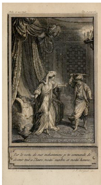
Le Cabinet des fées – Les Mille et Une Nuits

L'Histoire du Sultan du Yemen et de ses trois fils est narrée dans le cadre des Mille et Une Nuits 9 . La conteuse Shéhérazade ménage ses effets, elle interromp le récit quatre fois pour relancer le désir d'écouter la suite.