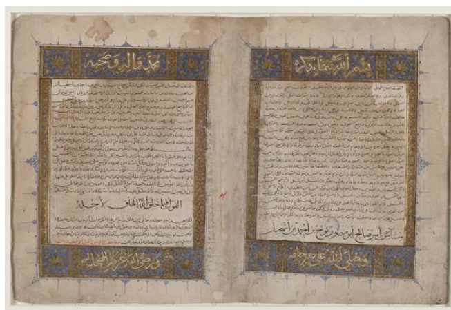
Un manuscrit de la traduction en persan par Bal'ami

L'ouvrage de Tabari a été composé en arabe, puis abrégé et traduit en persan en 963 par Bal'ami, vizir samanide (Iran du Nord-Est). L'abrégé persan a ensuite été traduit à nouveau en arabe et en turc. Fait rarissime, c'est donc par le jeu des traductions successives que le texte de Tabari nous est parvenu (seuls quelques fragments de l'ouvrage original ont été conservés).