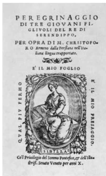
Frontispice de l'édition vénitienne de 1557

Dans le Peregrinaggio (1557), les princes de Serendip deviennent les héros de multiples aventures et leur histoire se diffuse dans toute l'Europe.