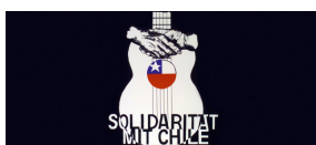
Table ronde - Michelle Bachelet, ses expériences d'exil et le coup d'État au Chili il y a 50 ans

27/09/2023 à 19h à la Librairie Portugaise et Brésilienne